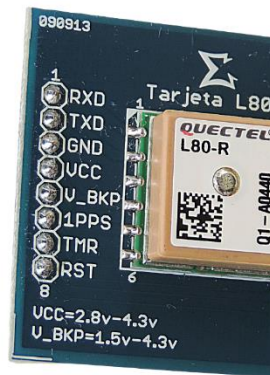
Figura 2: Pines de conexión